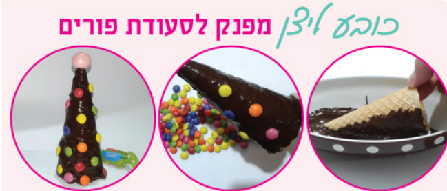
החומרים 6-5 כובעים ■ חב' שוקולד מריר ■ עשוי שוקולד - עדיף קטנים ■ 4 סוכריות טופי ■ גביעי גלידה ■ חב' שוקולד מריר ■ עדיף קטנים ■ 4 סוכריות טופי

מורן קורס - פסיכותרפיסטית, מטפלת רגשית, יועצת זוגית, מדריכת כלות ומרצה. 054-6712783 770moran@gmail.com